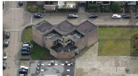
Foto uit 2020 van de school van de achterzijde / bovenzijde gezien.

Het terrein wordt aan de voorzijde en aan linker zijkant omgeven door een groenstrook afgezet met een haag. Aan de rechter zijkant zijn parkeerplekken gesitueerd. Direct achter de school is een groot speelplein. Op het noordelijk deel van het terrein ligt een gezondheidscentrum. Dit gebouw is in de jaren '80 gerealiseerd.