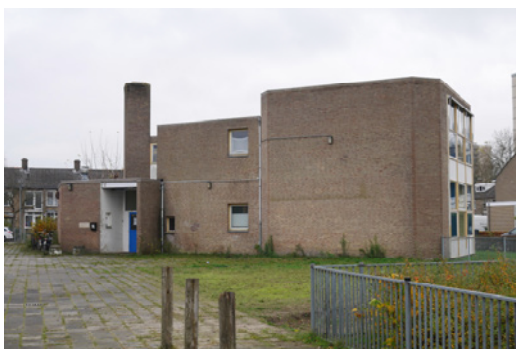
Foto uit 2020 van de zij/achtergevel.