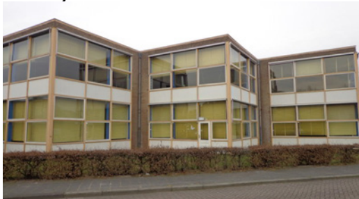
Foto uit 2020 van de voorgevel.

De gevels zijn sober uitgevoerd, zoals dat in die periode gebruikelijk was. Er was maar een beperkt budget voorhanden en alle bouwactiviteiten werden aan strikte voorwaarden en budgetten verbonden. Een school moest zo goedkoop en efficiënt mogelijk gebouwd worden. Deze beperkingen zijn goed zichtbaar in de sobere bouwstijl en de keuze van het materiaal.