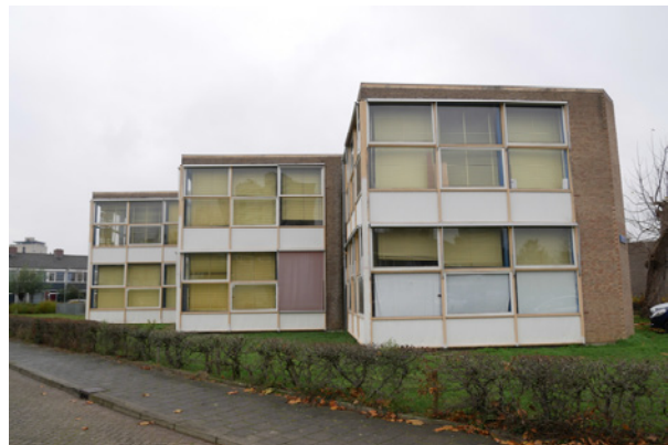
Obliëkfoto 2021 (links) en foto straatbeeld 2021 (rechts)