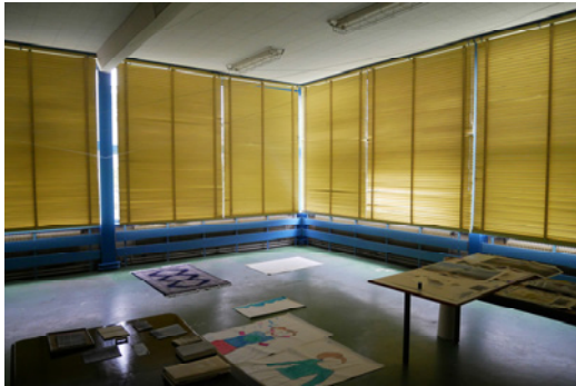
Foto uit 2020 van een klaslokaal.

maken voor een speelruimte voor de kleinste kinderen. Hierbij werd ook een stuk van de gang betrokken. Twee gangkasten nabij de lerarenkamer, zijn in 2003 aan de gangzijde dichtgezet en bij de lerarenkamer getrokken. Verder zijn er nog andere kleine wijzigingen doorgevoerd, zoals het afzagen van de toiletdeuren voor de jongste groepen en het verwijderen van de wasbak uit enkele lokalen.